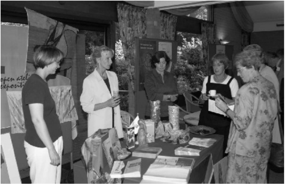
Op de CSC Markt: presentatie van maatschappelijke initiatieven