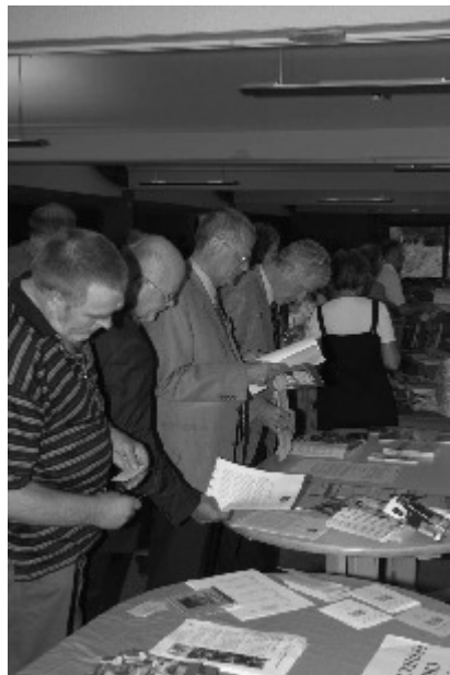
Op de CSC Markt

aan het begin van een nieuw millennium ook wel weer de belangrijkste karakteristiek van die beweging worden. Misschien is het dat ook al wel als je de vele initiatieven die op het ogenblik aan de basis plaatsvinden ziet en waar we hier de afgelopen dagen ook nogal wat van gehoord en gezien hebben. En een heel ander voorbeeld: zie de twee miljoen jongeren die vorige week in Rome inspiratie zijn gaan halen. Die mensen gaan naar huis met een heel duidelijk perspectief, althans als ze ten volle hebben beleefd wat daar is gebeurd. Die mensen gaan gewoon op hun plek doen wat ze te doen staat. Mijn hoop is dat de christelijk-sociale gedachte de komende tijd vooral tot uiting zal komen in een vernieuwingsbeweging, als actie die erop gericht is in nieuwe omstandigheden, op nieuwe manieren, in nieuwe vormen samenhang en verbondenheid te scheppen, zodat eraan wordt bijgedragen dat elk mens