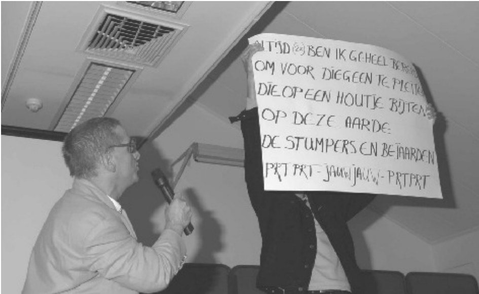
Cabaret tijdens de conferentie: “De Rode Purk”