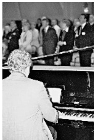
Tijdens de ochtendmeditatie