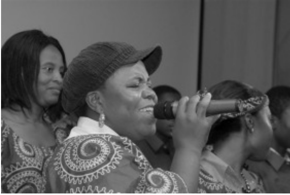
Pentecost Revival Church Choir uit Amsterdam